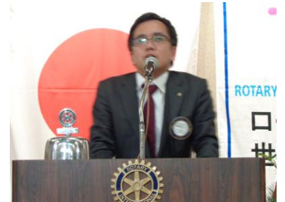
「ローターアクトの活動にご協力下さい」