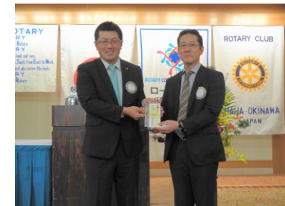
桑原会員は、めでたくウチナムームクに。末永くお幸せに。