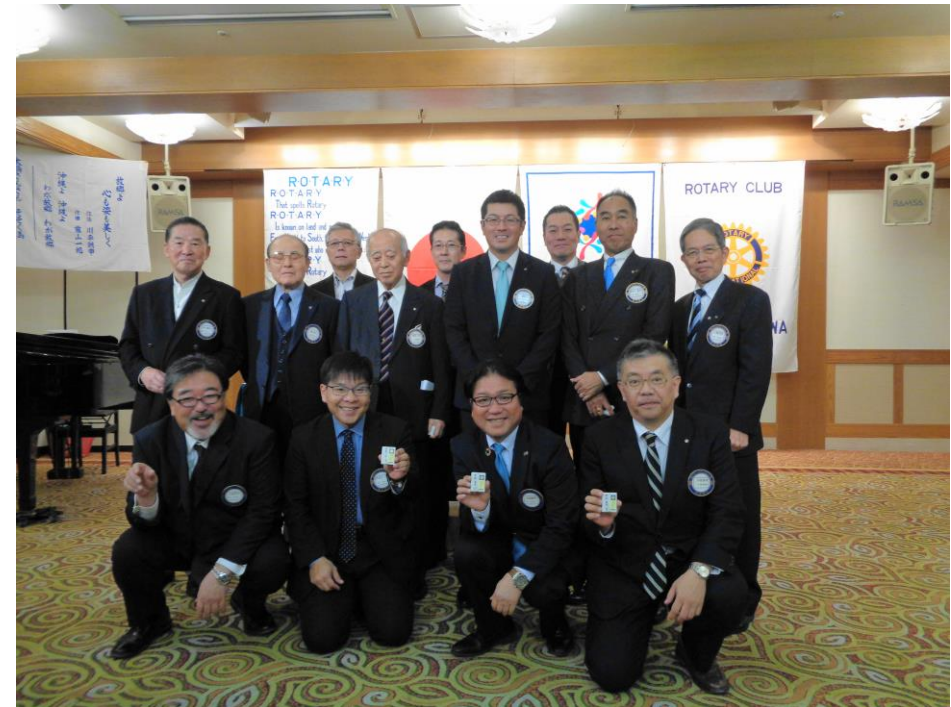
「ロータリーは、例会出席から」を 実践された会員の皆さん