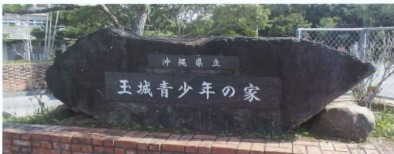
自然に囲まれた 県立玉城青少年の家と、そこからの眺望