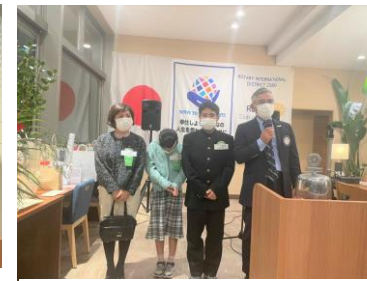
比嘉会長ファミリー