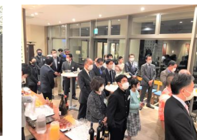
久しぶりの家族会は盛況です