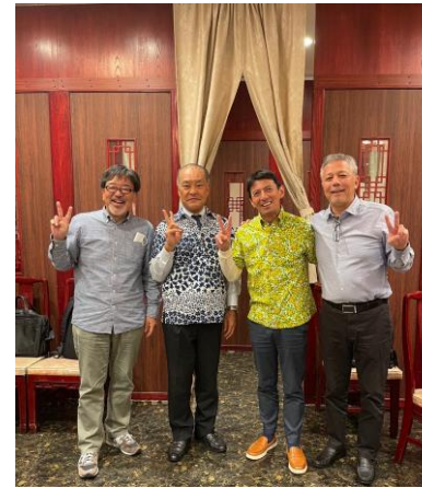
大変お世話になり、ありがとうございました。