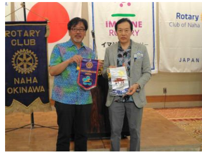
糸田会長と金城会長(写真右側より)