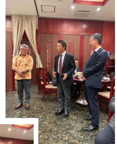
新会員の皆様、どうぞよろしくお願いいたします。