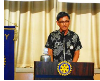
是非ご参加下さい。

*先日開催されましたインターアクトクラブ会長幹事会に参加致しました。今後のインターアクトの活動につきまして皆様へご報告申し上げます。多くの会員のご参加よろしくお願い致します。